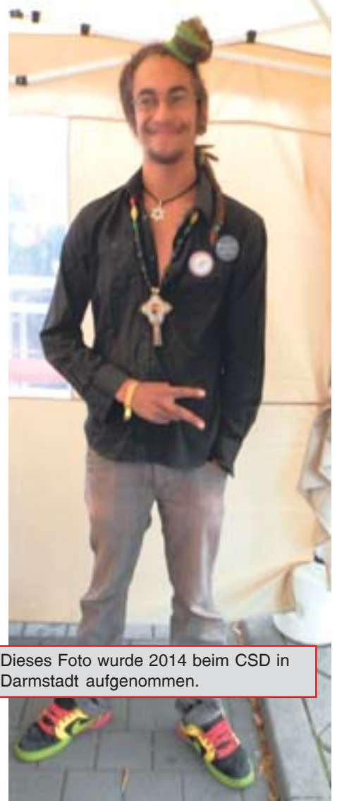
Dieses Foto wurde 2014 beim CSD in Darmstadt aufgenommen.